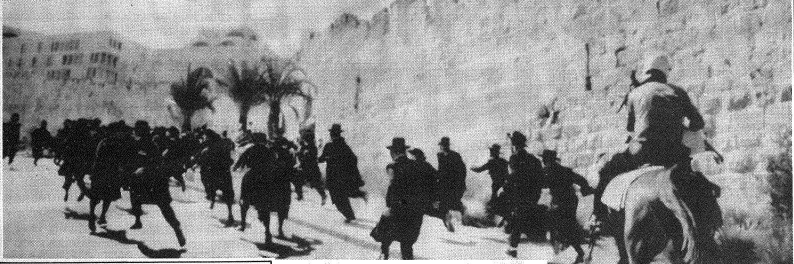
פיוזר הפגנת שבת בירושלים, תמונה מתוך עיתון זו: "כוח מוליד כוח. חוקה מגינה על המיעוט"